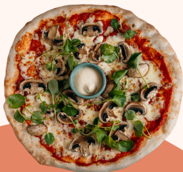
FUNGHI 14.50 🌿

Pizza met tomatensaus, mozzarella en salami