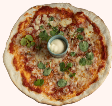
MARGHERITA 13.50 🌿

Wist je dat je ook 24/7 pizza's kan halen uit ons Pizza-automaat bij NEST