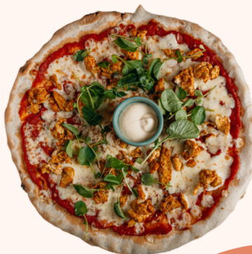
SHOARMA 15.50 🌿

Pizza met tomatensaus, mozzarella en champignons